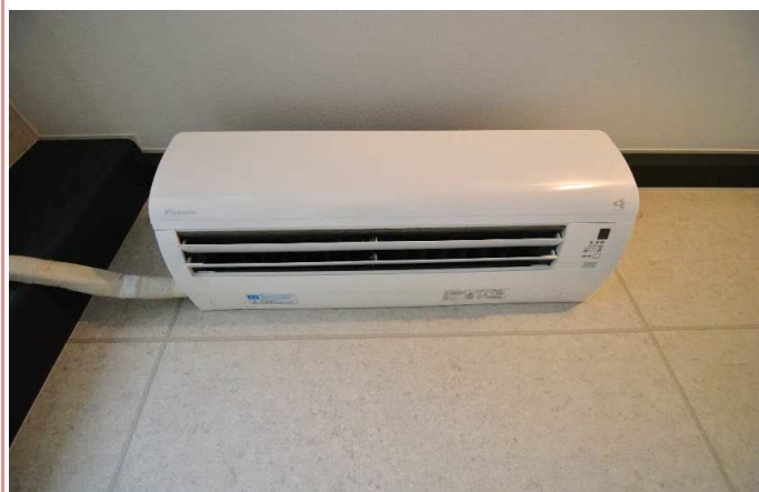
エアコン 2017年新設済み