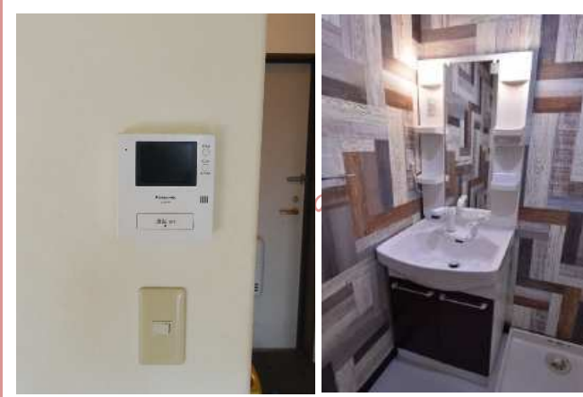
TVモニターフォン・洗面台 2017年新設済み