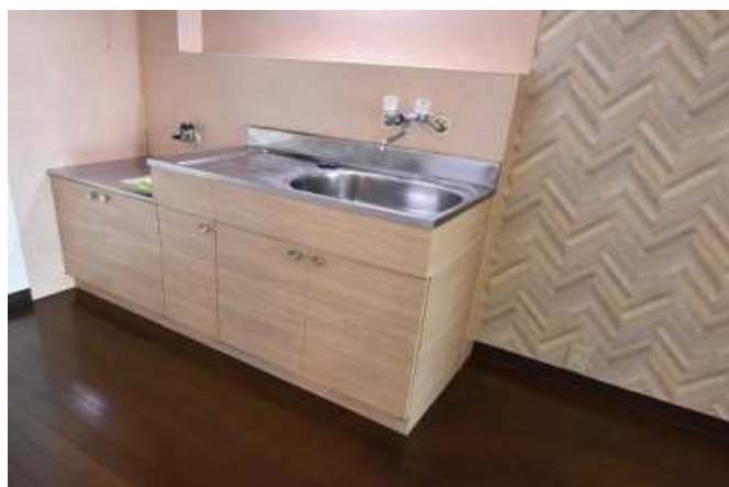
設備として、2口ガスコンロ付（ガス開栓時設置）