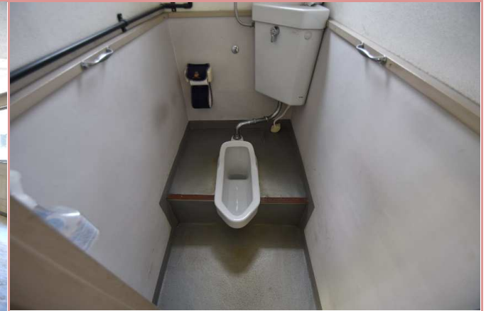
共用スペース内トイレ 和式水洗