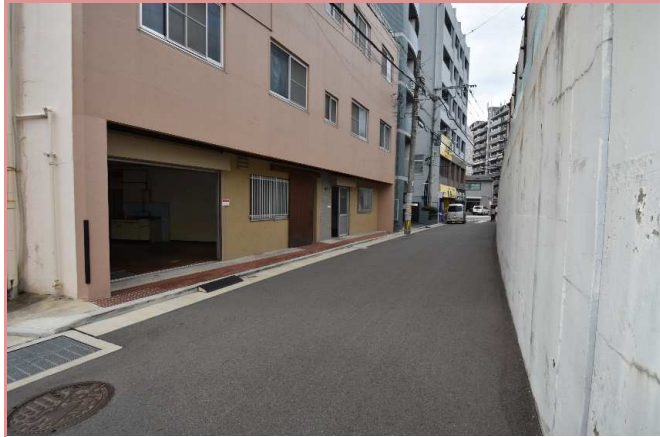
入口前通路 寄り付け・荷物の搬入がし易い！ 駐車場条件 近隣駐車場(月極)をご検討下さい