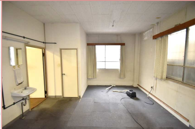
共用スペース部分 快適空間に変身予定🌀