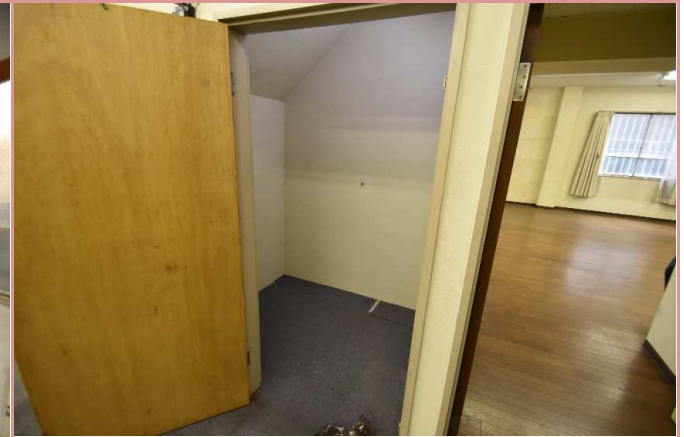
収納は奥行きがあり、大容量です！

資料と現状に相違があった場合は、 現況を優先させていただきます 。お申込み等をされる場合は、 必ず現地確認 を実施していただきますようお願いいたします。 管理会社 (株)アチーブメントプラス