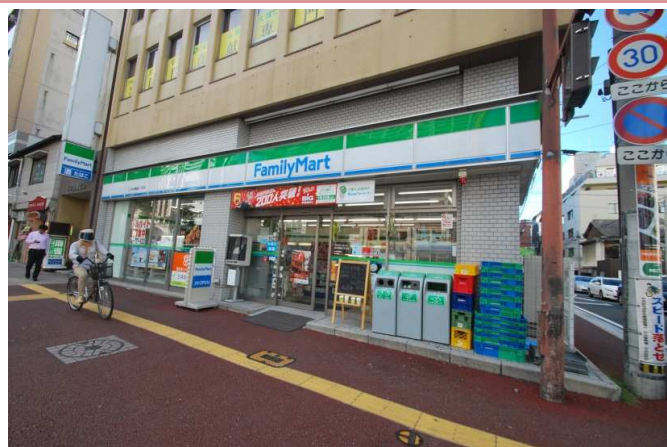
コンビニまで徒歩1分