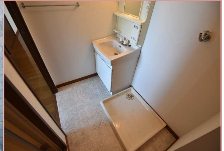
もはや必須の独立洗面台もございます😊 意識高め系の方、ココ！萌えポイントですよ！👁👁