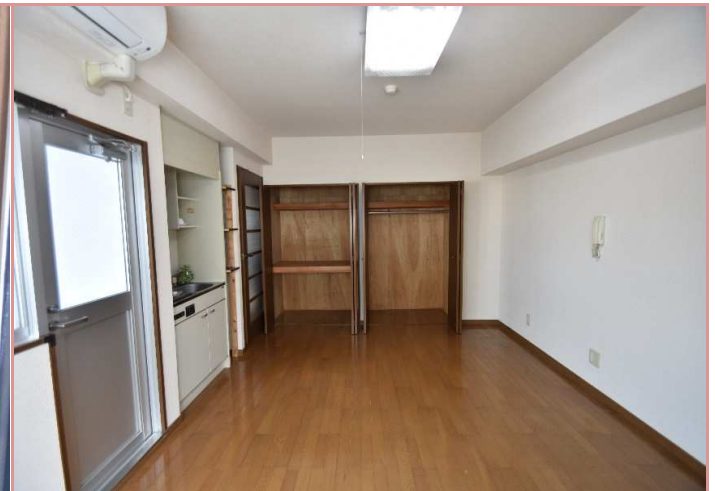
収納力には自信があります☆

資料と現状に相違があった場合は、現況を優先させていただきます。お申込み等をされる場合は、必ず現地確認を実施していただきますようお願いいたします。 管理会社 (株)アチーブメントプラス