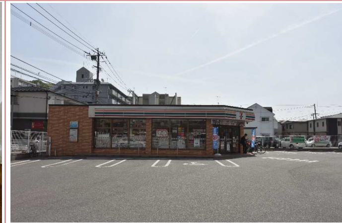
セブンイレブンがすぐ近くにありますが

資料と現状に相違があった場合は、 現況を優先させていただきます 。お申込み等をされる場合は、 必ず現地確認を実施させていただきます ようお願いいたします。 管理会社 (株)アチーブメントプラス