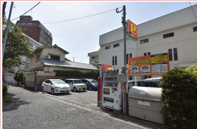
当マンションには駐車場がございませんが、最寄りには 月極駐車場、コインPが多くございますのでご利用下さい。