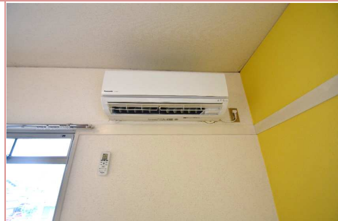
エアコン 2017年3月に交換済み