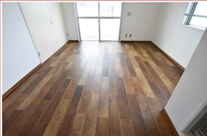
洋室 床張替えました。