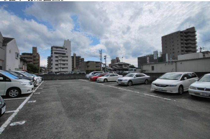
当マンションには駐車場がございませんが、最寄りには月極駐車場、コインPが多くございますのでご利用下さい