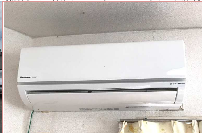
オシャレなクロスでオススメ☆

資料と現状に相違があった場合は、 現況を優先させていただきます 。お申込み等をされる場合は、 必ず現地確認を実施させていただきます ようお願いいたします。 管理会社 株式会社アチーブメントプラス