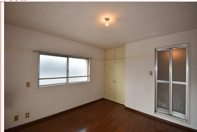
洋室 ※同タイプ別部屋写真