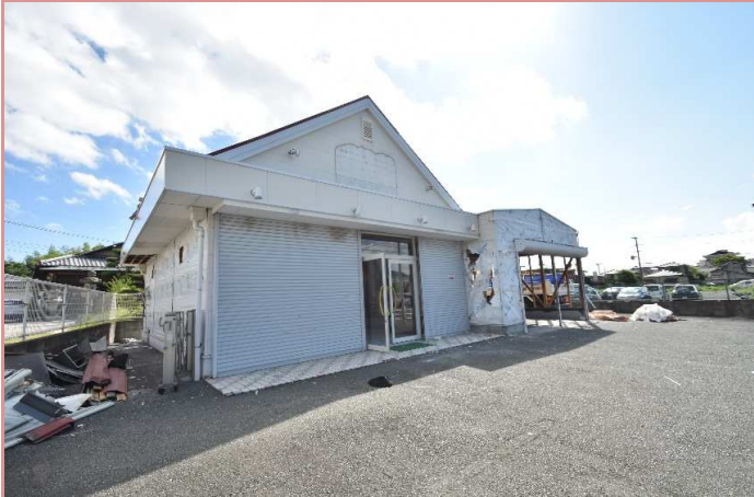
H29年8月より 解体工事 開始となりました！