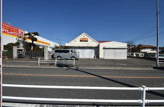
敷地全体 正面より 道路を挟んだ目の前には、コンビニがございます♪