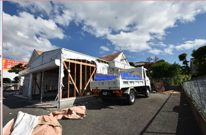
駐車場条件 6台駐車可（現地要確認）