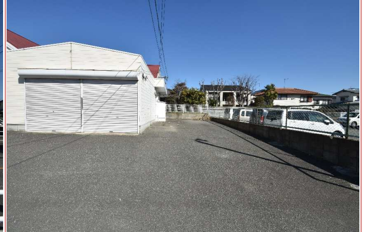
敷地内 駐車スペース🚗