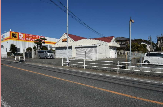
既存と同等規模の建物です🏠