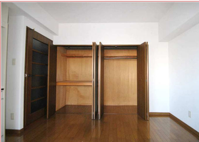
押入とクローゼットの夢の共演 ✨ 奥行きもあるので、収納ダンスまですっぽり♪