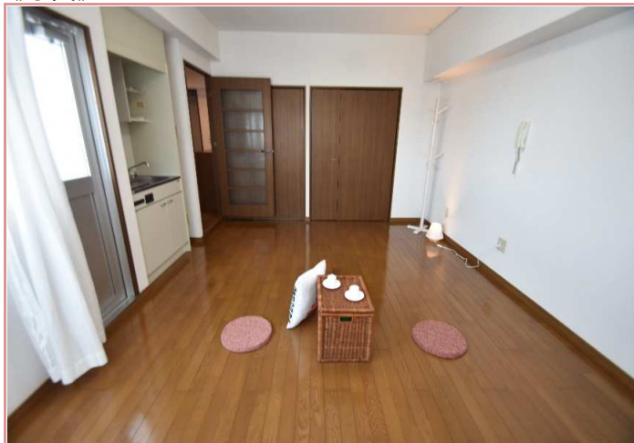
10畳あれば、色んな活用法があるうー キングサイズのベッドも置けますよ☺ 注※狭くはなりません