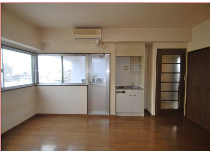
2面採光ならではの明るさと風通し☀ エアコンも新調致します🍃