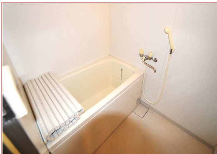
写真で伝わりますでしょうか？ 軽く足を伸ばして入浴出来る位の広さなんです✧