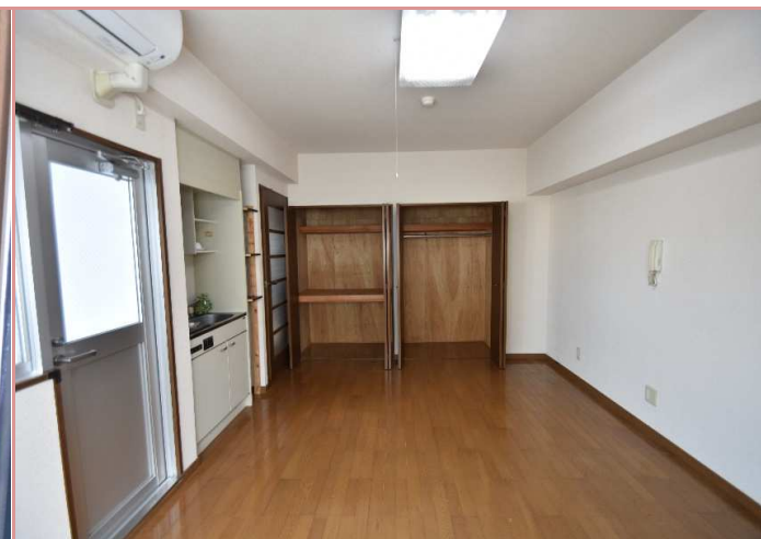
収納力には自信があります☆

資料と現状に相違があった場合は、現況を優先させていただきます。お申込み等をされる場合は、必ず現地確認を実施していただきますようお願いいたします。 管理会社 (株)アチーブメントプラス