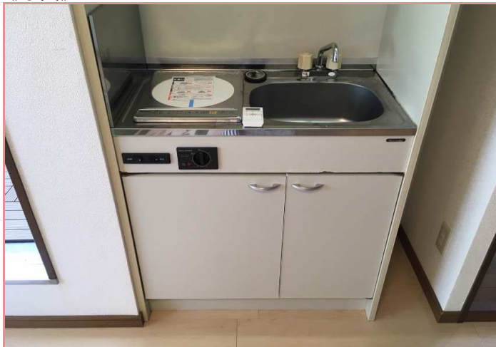
電気コンロからIHコンロへ新調予定！