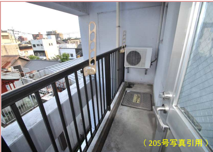
ウッドデッキ調に変更してみてもいかが？ ※同タイプ別部屋写真