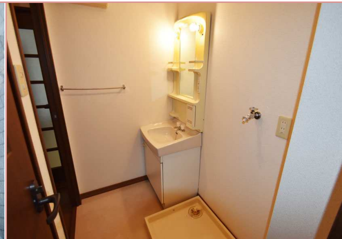
もはや必須の独立洗面台もございます😊 意識高め系の方、ココ！萌えポイントですよ！👁👁