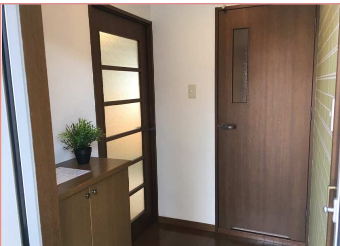
玄関には靴箱も収納もございます！ この収納スペースは本当に有り難い。(。人。)