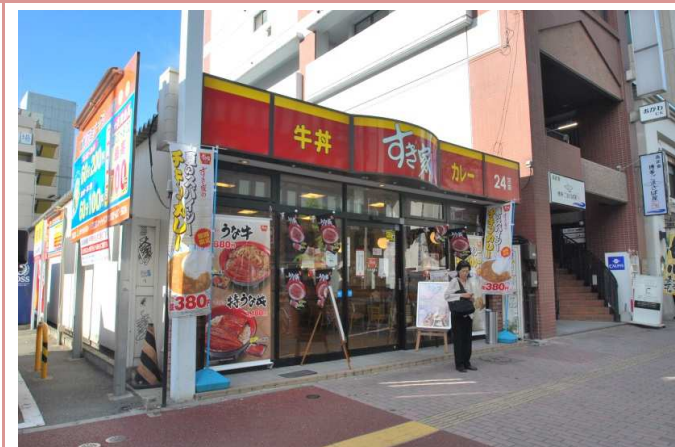
すき家まで徒歩1分