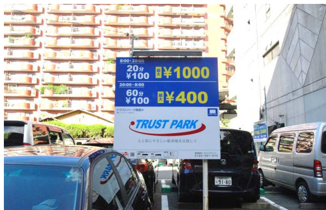
駐車場 なし/近隣に100パーキングあり