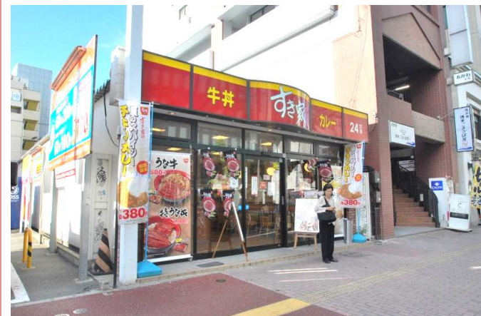
すき家まで徒歩1分