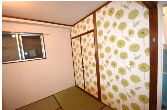
アクセントクロス