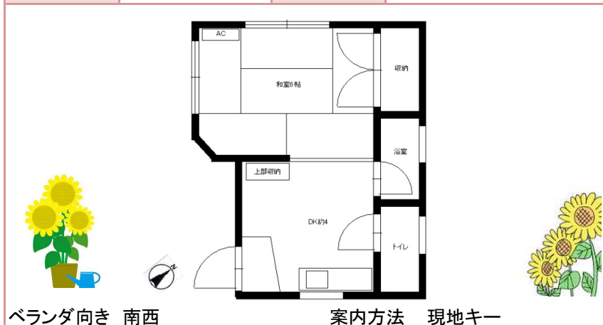
ベランダ向き 南西 案内方法 現地キー