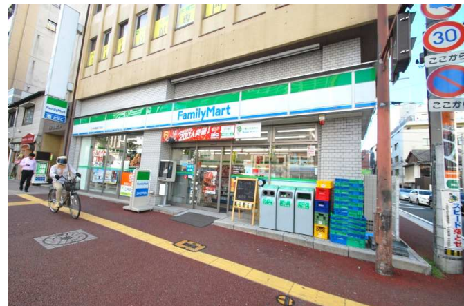
コンビニまで徒歩1分