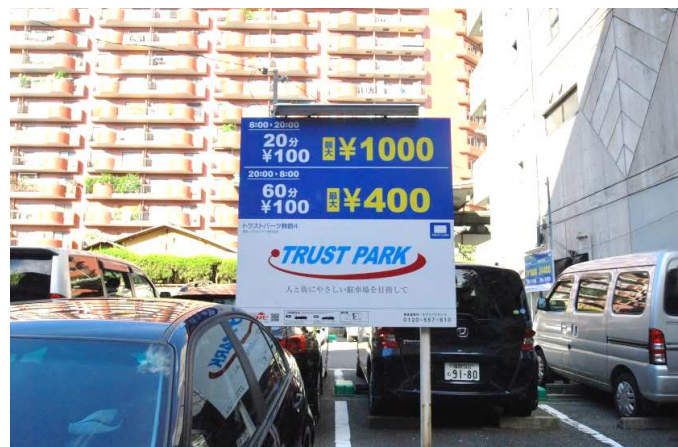
駐車場条件 なし/近隣に100パーキングあり