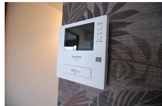
モニター付きインターフォン