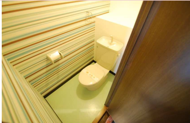
トイレ 明るい空間！棚もあり便利です。