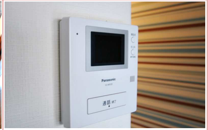
TVモニターフォン 来客時も安心です。