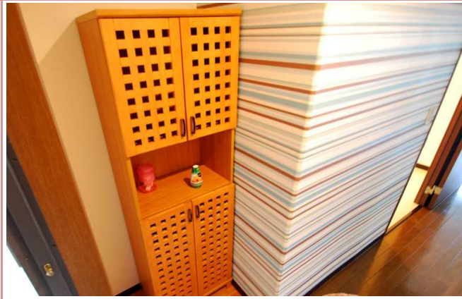
玄関 余裕がありながらスッキリしてます。