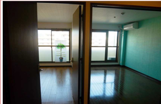
開放的に開けて使うもよし。