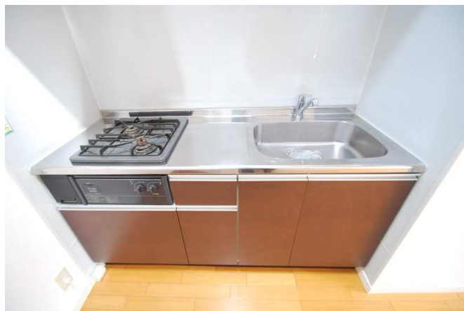
2口コンロ付の広々キッチン