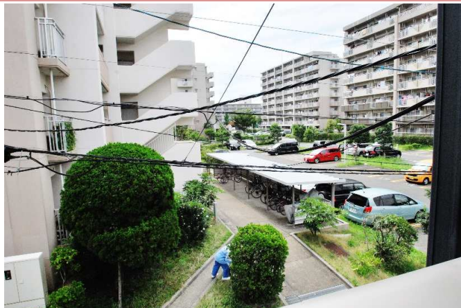
静かな住宅街です。