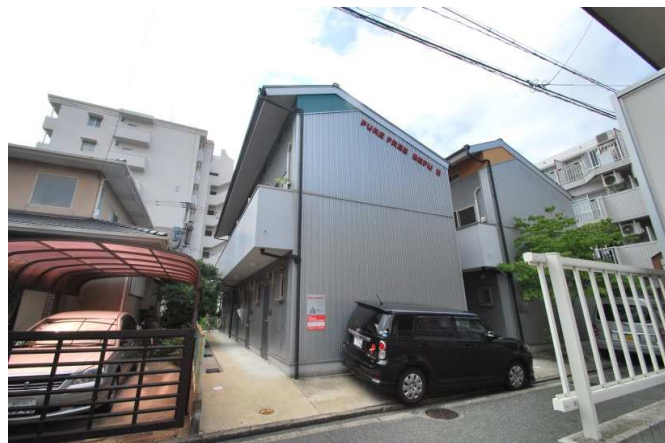
オシャレな外観になっております。