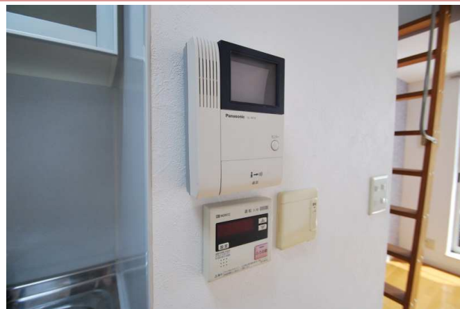
設備も充実してます。

資料と現状に相違があった場合は、 現況を優先させていただきます 。お申込み等をされる場合は、 必ず現地確認を実施させていただきます ようお願いいたします。 管理会社 株式会社アチーブメントプラス