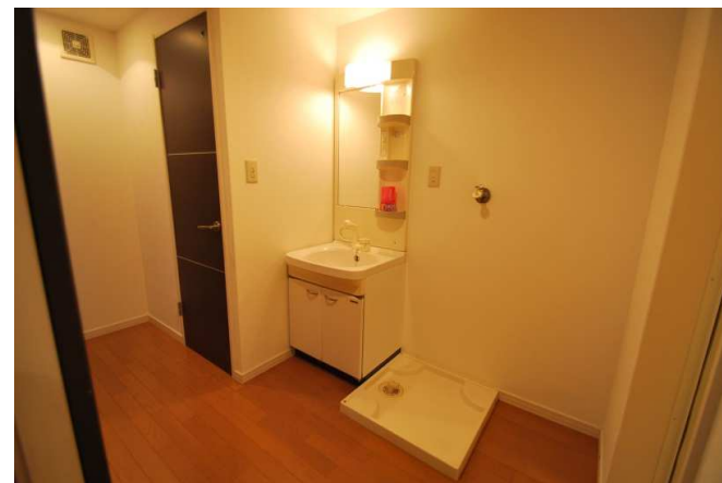
洗面脱衣所も広々です。