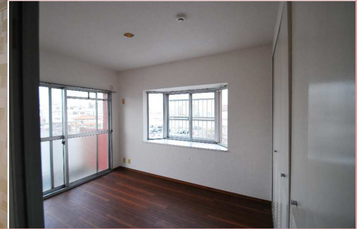
洋室 出窓がついていて明るい！