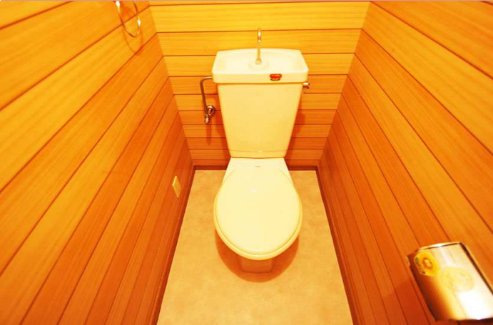
トイレも木目でオシャレです。