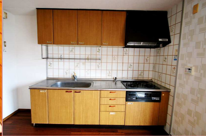
使い勝手の良さそうなキッチン！ ビルトインコンロもおすすめです。