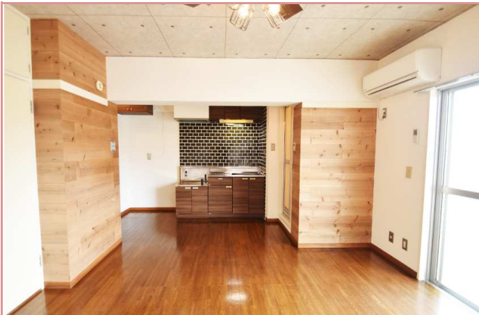
キッチン 料理好きのあなたにも♥