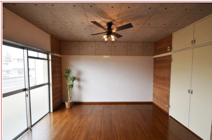
洋室 収納は、押入とCLのいいとこどりなんですよ！