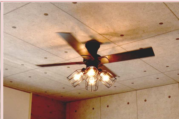
洋室 只今、ステキなシーリングファン照明プレゼント♪