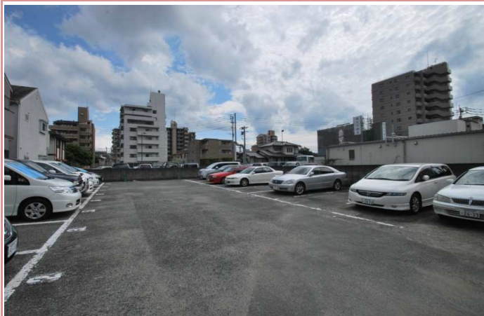
当マンションには駐車場がございませんが、最寄りには月極駐車場、コインPが多くございますのでご利用下さい。