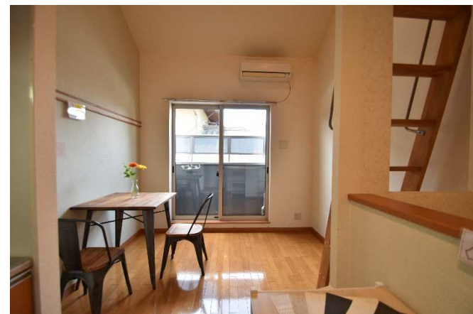
今なら、クロスをお選び頂けます☆