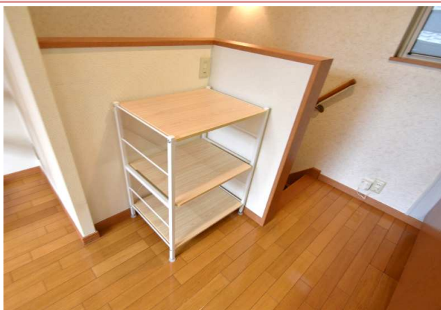
ちょっとしたものを置ける棚、プレゼント！新品！