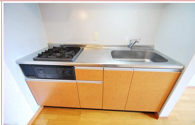
2口ビルトインコンロ付になっております。