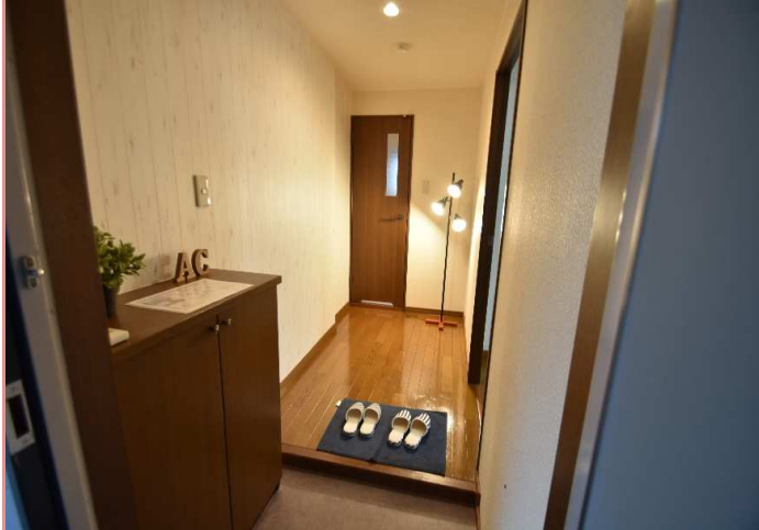
玄関～廊下部分 アクセントクロス施工 ☺