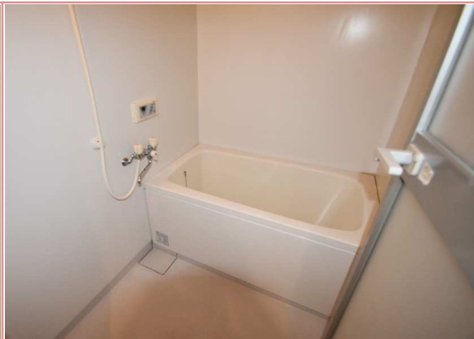
浴室 単身用の浴室とは思えない広さ！ゆったりつかれます♪