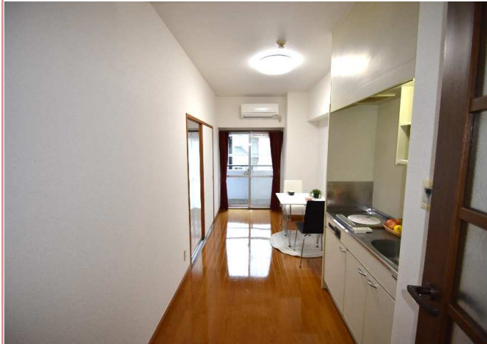
ダイニング部分 LEDシーリングライト設置！