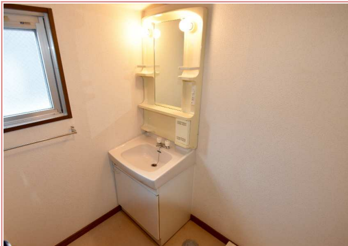
独立洗面脱衣所・室内洗濯機置場