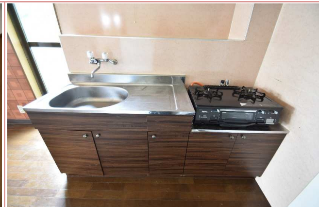
キッチン 2口コンロ付き