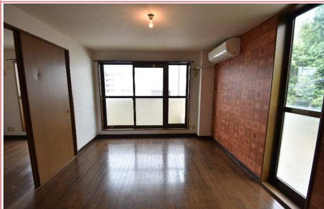
洋室 角部屋の特権！2面採光