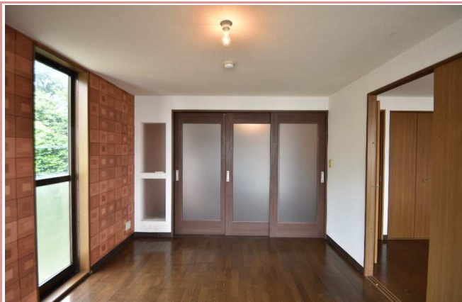
洋室 DKとの間に3枚稼働の建具ついています。