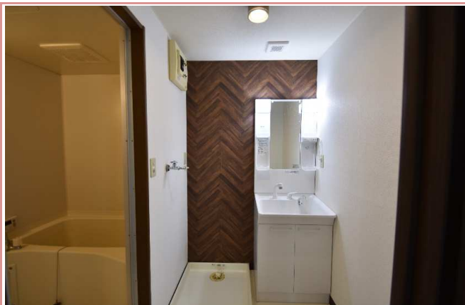
女性の方にご要望の多いシャブードレッサーを設置。バルコニー