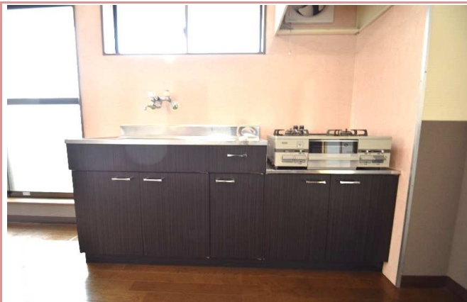
キッチン 小窓からの明るい採光