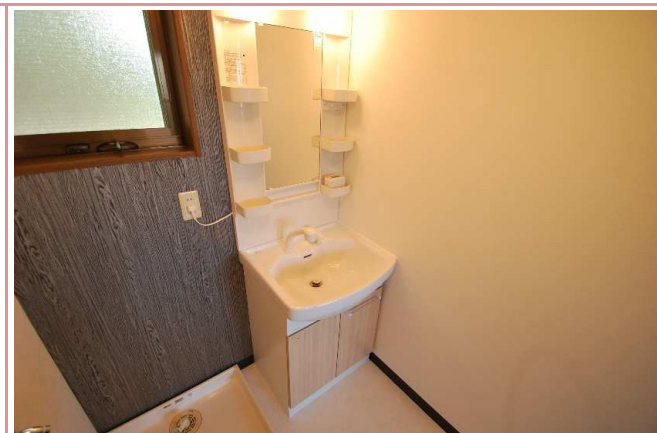
洗面台も前回交換済み