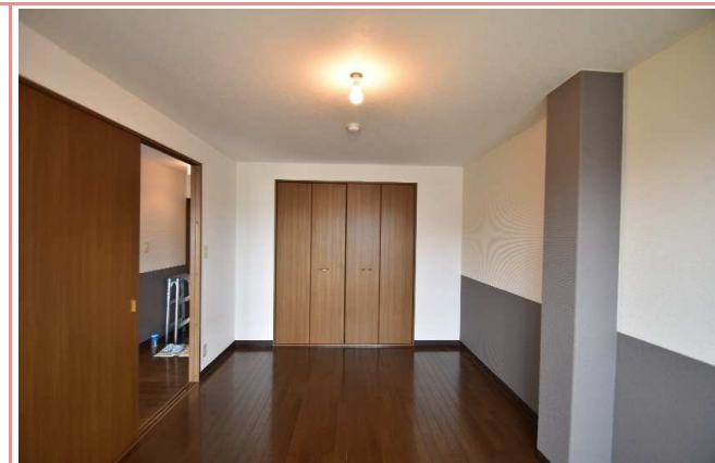
洋室 ゆっくりくつろげます。