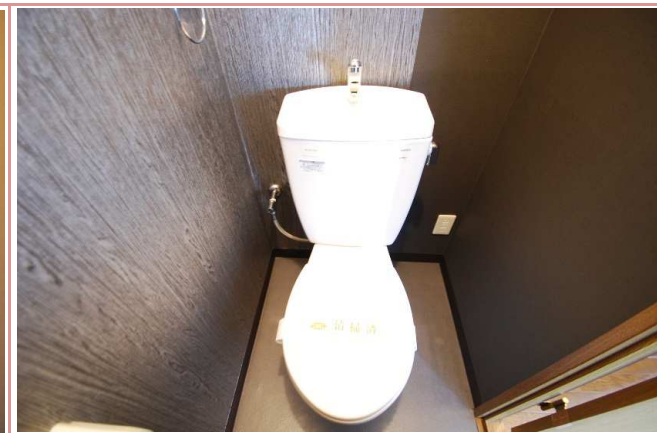
トイレ (コンセント有り)

資料と現状に相違があった場合は、 現況を優先させていただきます 。お申込み等をされる場合は、 必ず現地確認 を実施していただきますようお願いいたします。 管理会社 (株)アチーブメントプラス