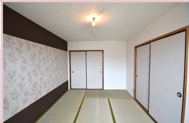
和室 アクセントクロスでおしゃれな和室