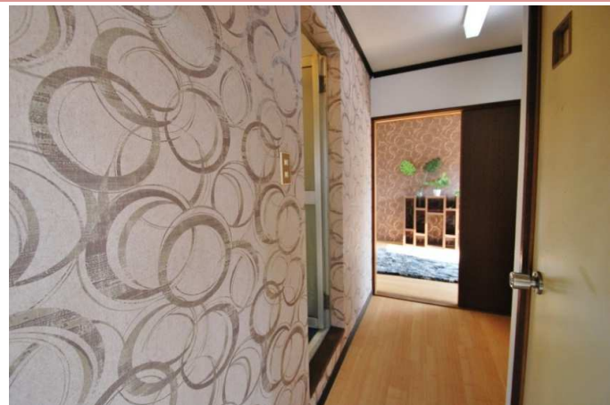
入口アクセントクロス