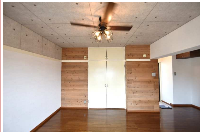
洋室 安心の収納力☆