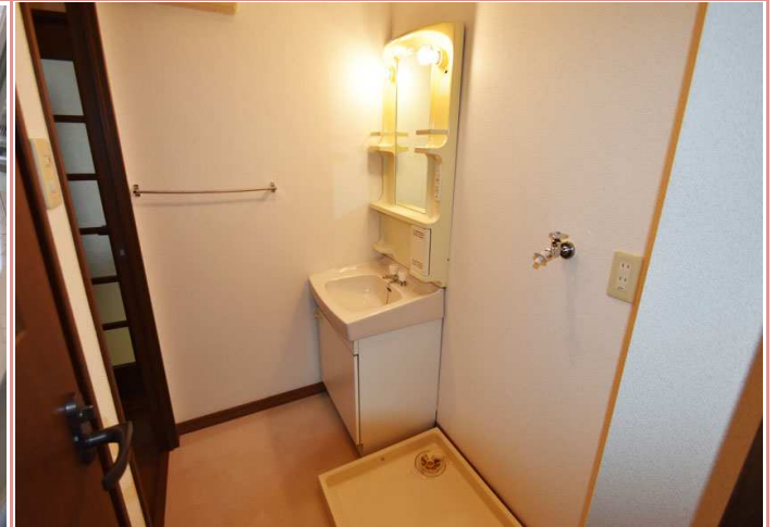
もはや必須の独立洗面台もございます 😊 意識高め系の方、ココ！ 萌えポイントですよ！👁👁