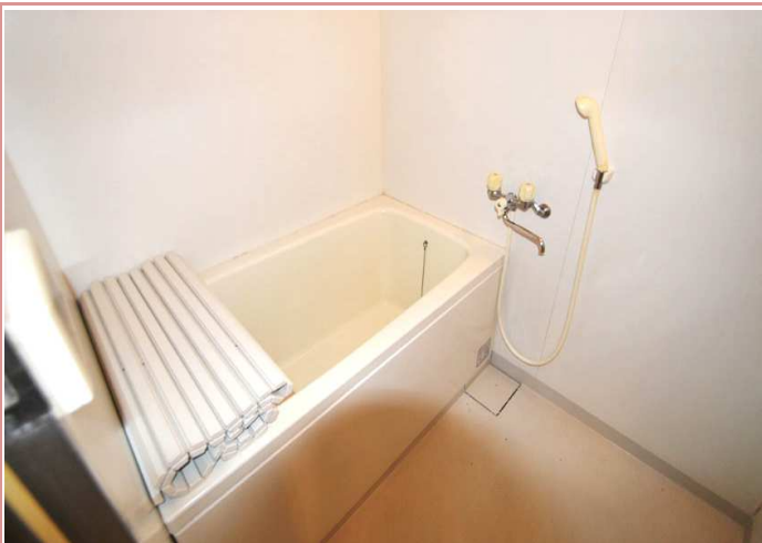
写真で伝わりますでしょうか？ 軽く足を伸ばして入浴出来る位の広さなんです✧