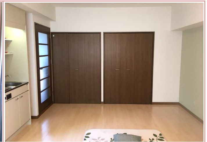
明るく生まれ変わったお部屋でくつろぎの時間を！