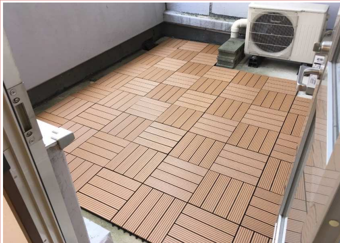
ウッドデッキ調に変身したバルコニーをどう使いますか？