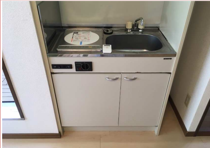
電気コンロからIHコンロへ新調しました！