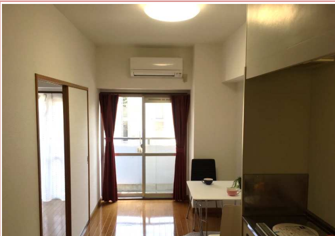
ダイニング部分 LEDシーリングライト設置！