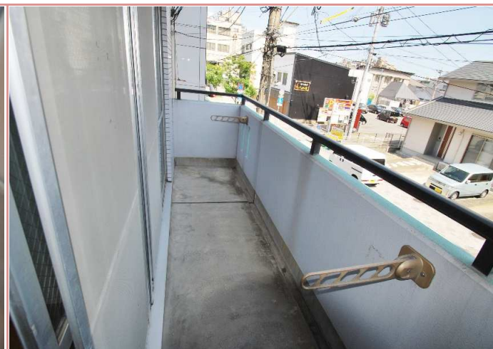
ベランダ 南向きで日当たり良好です◎