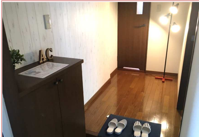
玄関～廊下部分 アクセントクロス施工 ☺