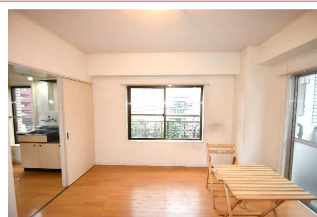
室内 角部屋で2面採光です。