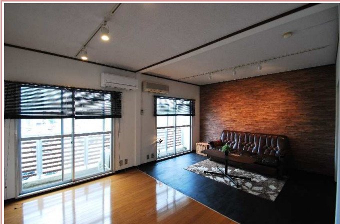
ライティングレール仕様！