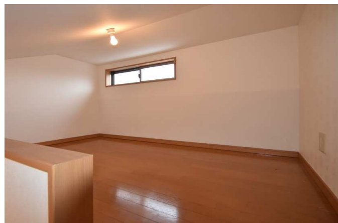
嬉しいロフト付き！！