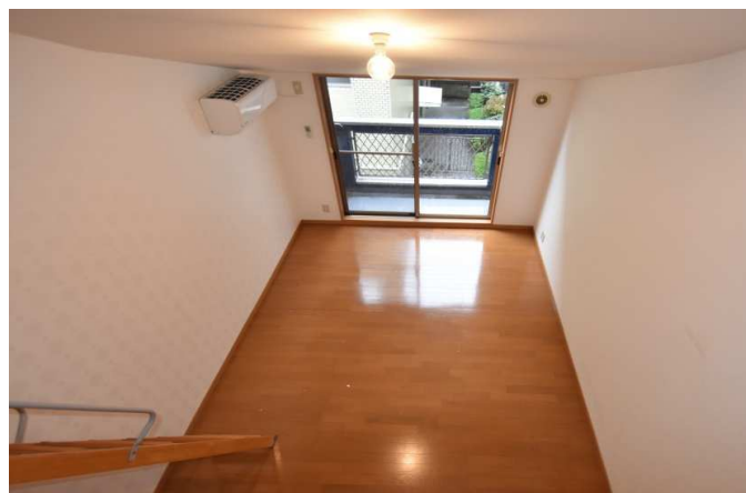
白色のアクセントクロスへ生れ変ります