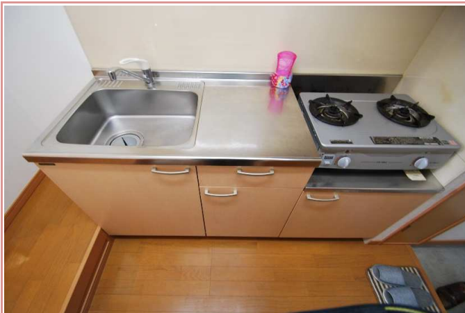
2口コンロも悠々置けます。※コンロは付きません。