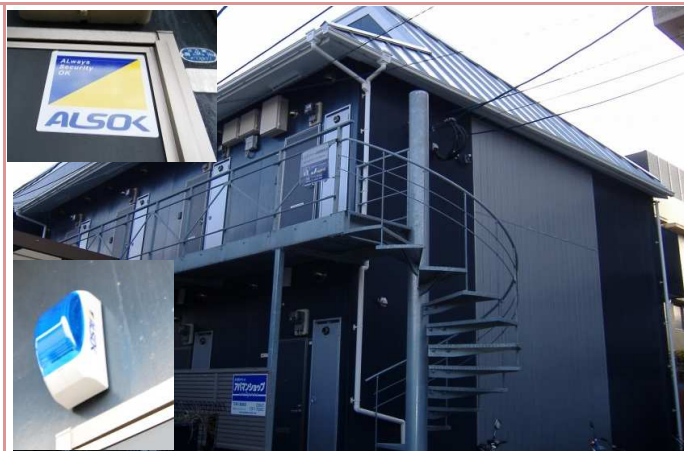
2階へは螺旋階段です！！セキュリティー強化してます