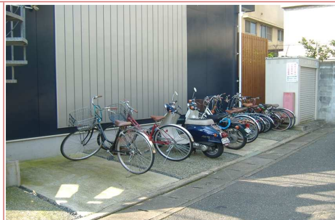
駐輪場もあります！！

資料と現状に相違があった場合は、 現況を優先させていただきます 。お申込み等をされる場合は、 必ず現地確認を実施させていただきます ようお願いいたします。 管理会社 株式会社アチーブメントプラス