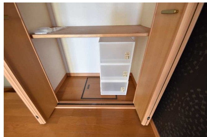
収納内でも使える、無印〇品のボックスプレゼント！ ※ もちろん新品♪