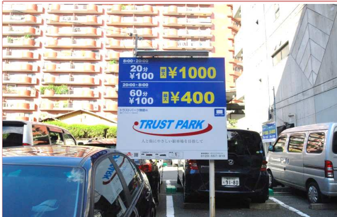
駐車場条件 近くに100円パーキングがあります。