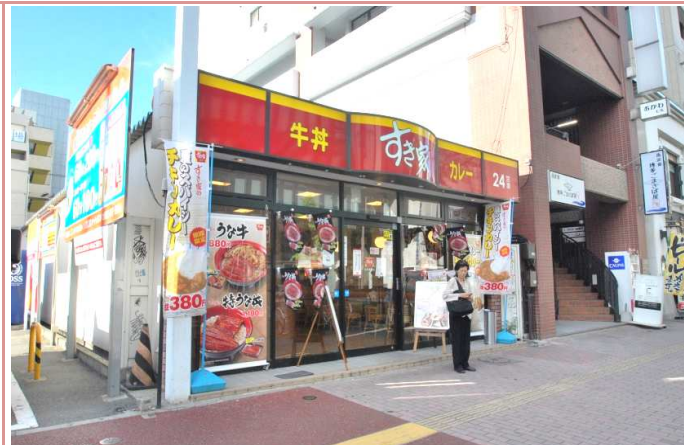
すき家まで徒歩1分

資料と現状に相違があった場合は、 現況を優先させていただきます 。お申込み等をされる場合は、 必ず現地確認を実施していただきますようお願いいたします 。 管理会社 ㈱アチーブメントプラス