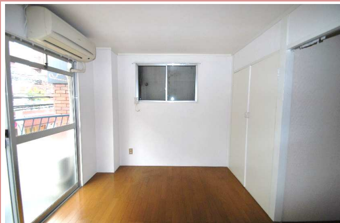
洋室 小窓付いています。