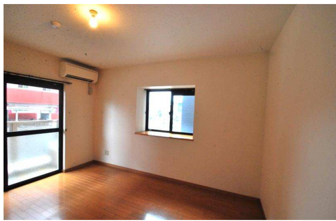
リビングにも出窓がついてます。