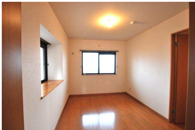
角部屋の特権！多面採光で日当たりも良好です。