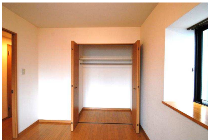
大型のクローゼット。

資料と現状に相違があった場合は、 現況を優先させていただきます 。お申込み等をされる場合は、 必ず現地確認を実施させていただきます ようお願いいたします。 管理会社 (株)アチーブメントプラス