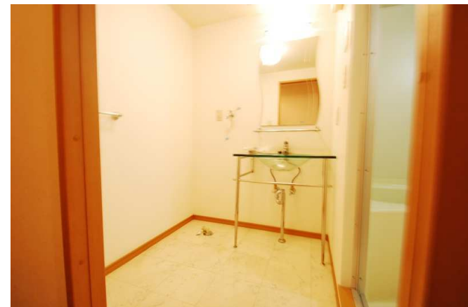
脱衣場も広いスペースを確保 ※洗面台新調します。