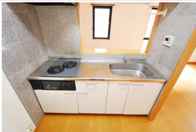
2口ビルトインガスコンロ搭載です。