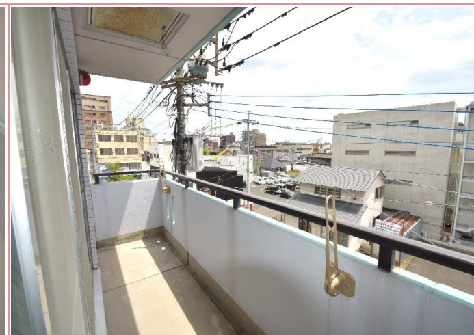
ベランダ 南向きで日当たり良好です◎

資料と現状に相違があった場合は、現況を優先させていただきます。お申込み等をされる場合は、必ず現地確認を実施していただきますようお願いいたします。 管理会社 (株)アチーブメントプラス