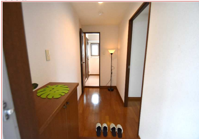
玄関～廊下部分 持て余すくらい広い廊下です！趣味の物を置いても◎