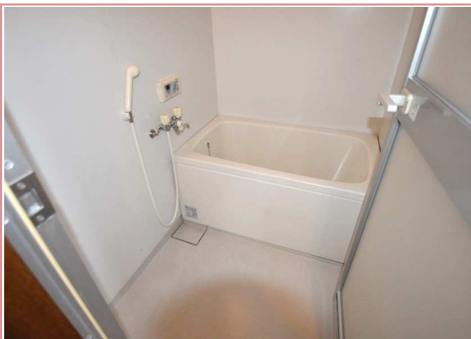
浴室 単身用の浴室とは思えない広さ！ゆったりつかれます♪