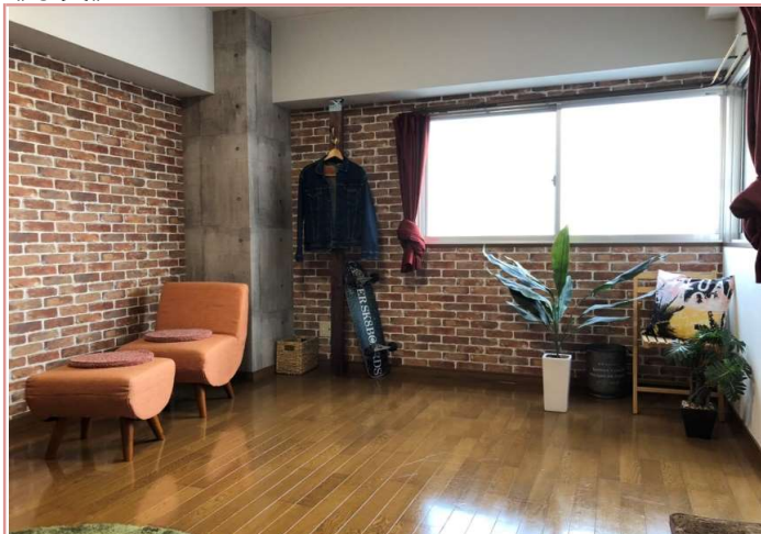
自然に風化して味わいをまじったレンガをイメージした落ち着いた雰囲気の室内。