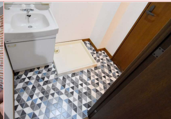
洗面化粧台と洗濯機スペース。トイレと浴室への動線にも工夫があります。