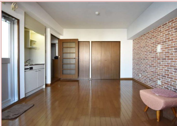
室内は2面採光で日当たりもとても良好です。ペットだけではなく、ソファやテーブルも配置可能です。