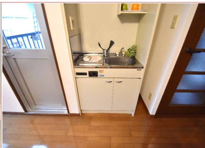
シンプルで使い勝手がいいキッチンです♪