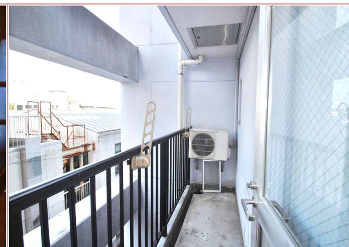
ベランダは、道路に面してないので、洗濯物やお布団も気にせず干せちゃいます☺☺