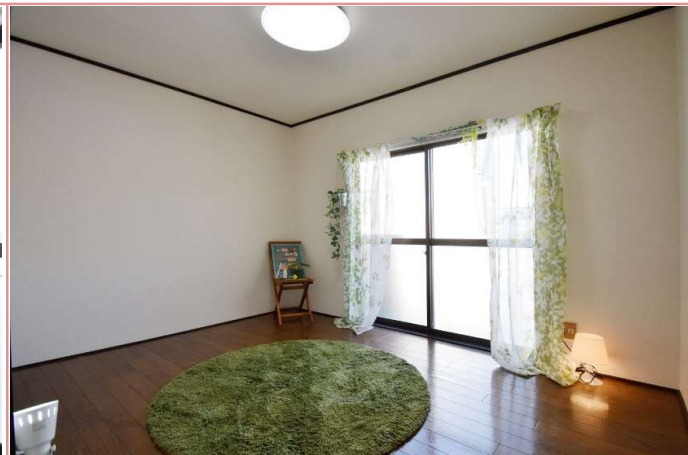
洋室 * 同タイプ別部屋