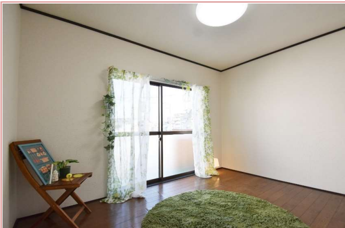
洋室 * 同タイプ別部屋