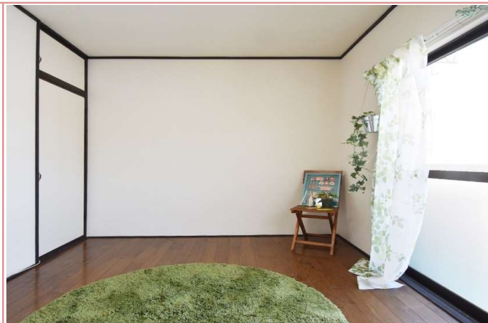
洋室 * 同タイプ別部屋