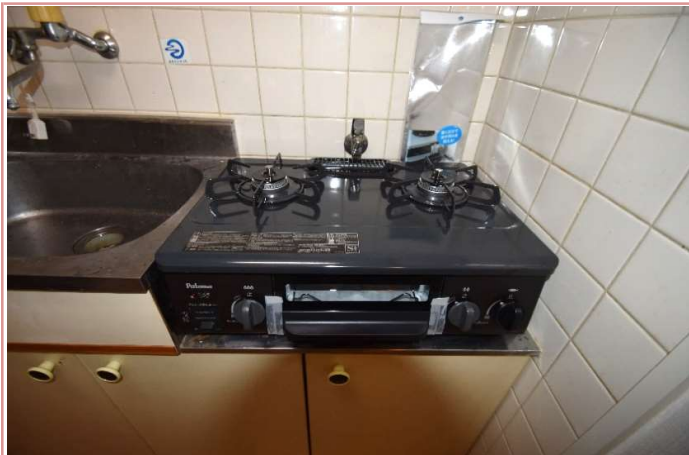
2口コンロも置けます! 駐車場条件 駐車場無し(近隣に月極有り)