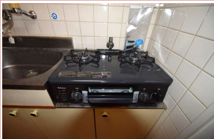
2口コンロも置けます！ 駐車場条件 駐車場無し(近隣に月極有り)