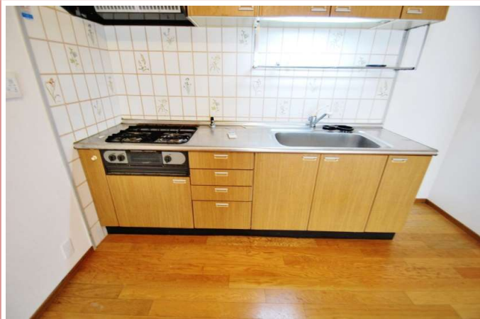
ビルトインコンロ！ 使いやすいそうなキッチン！