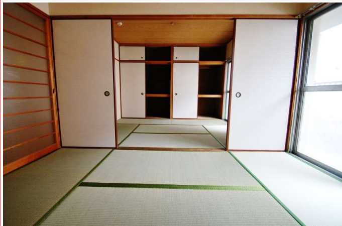
日本人の心！ 落ち着いた和室！！