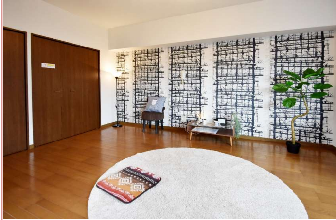
1Rでも侮るなかれ！ 10畳あれば、色んな活用法があります