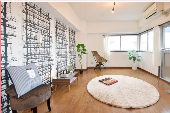
2面採光の洋室 明るって気持ちがいい