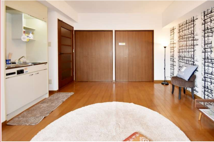
押入とクローゼットの夢の共演 奥行きもあるので、収納ダンスまですっぽり！