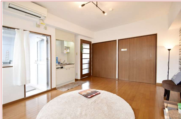
電気コンロはIHコンロへ交換 ガスに比べてお掃除ラクです