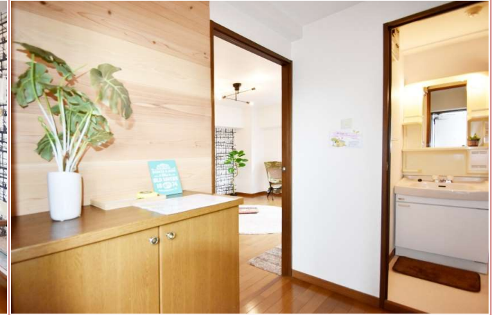
玄関の間口が広かって地味に嬉しい 靴箱の上に足場板を貼りました