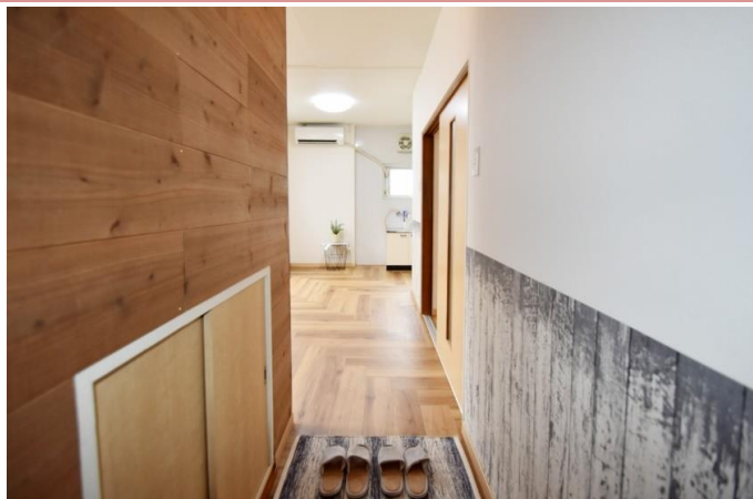
玄関もコダワっています