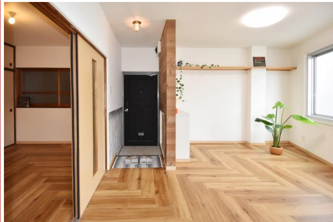
リビングスペース 元祖ヘリンボーン仕様の床です