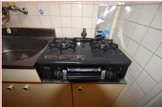
2口コンロも置けます!